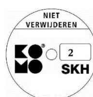
geschikt voor weerstandsklasse 2