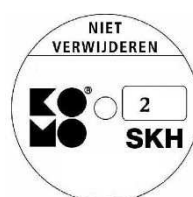
geschikt voor weerstandsklasse 2